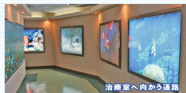
治療室へ向かう通路