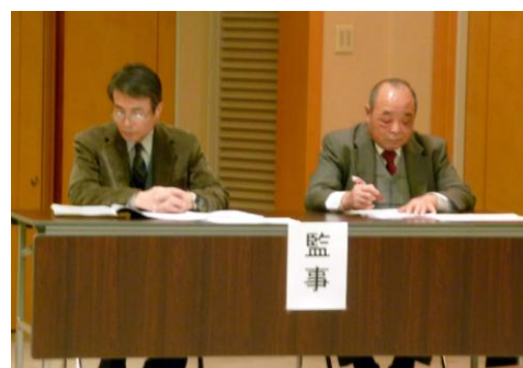
北山監事（左）と 森岡監事