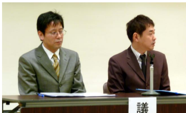
議長の三輪会員（左）と中川会員