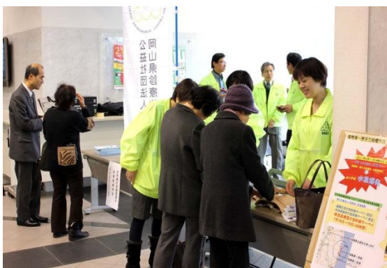
岡放技ブースの様子

今回のセミナーでは、展示コーナーを通じて、各会の仕事内容を一般市民の皆様にご覧いただく良い場になったのではないかと感じた。次年度は、岡山県診療放射線技師会が主に企画を行う予定となっているため、3団体で議論できるような共通のテーマや聴講したい講演内容など会員からの企画提案や情報提供が頂けると幸いである。