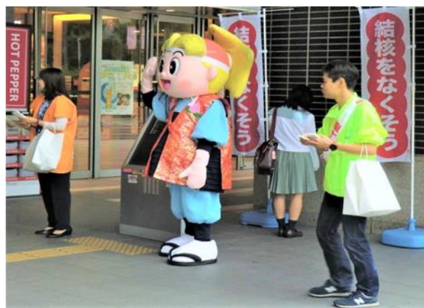
キャンペーンの様子