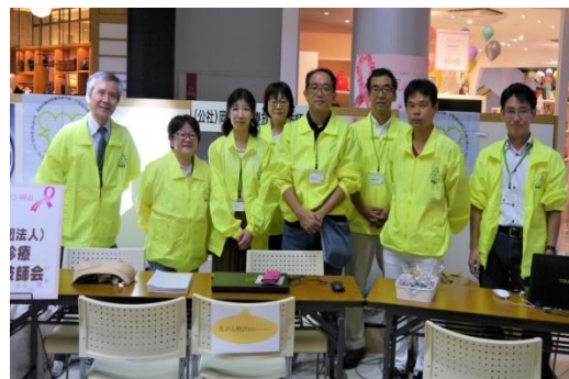
参加されたスタッフ一同