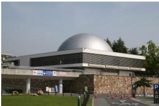
人と科学の未来館サイピア/岡山生涯学習センター